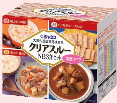
クリアスルー NB 3食セット 增量タイプ