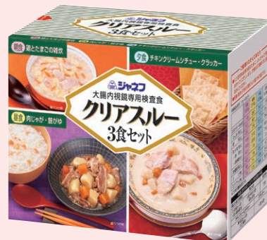
クリアスルー 3食セット