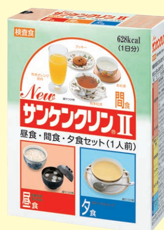
NEW サンケングリン II