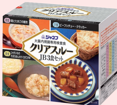
クリアスルー JB 3食セット